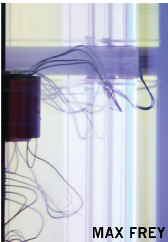
Rotor d/200 | 2006

Engel: ansteuerbare LED-Lampen auf einem rotierenden Aluminiumblech erzeugen eine kreisförmige Lichtzeichnung. Die vier ebenfalls rotierenden Programmscheiben, die die Leuchtmittel steuern, sind mit geätzten Zeichnungen versehen, die elektrisch leitfähig sind. Für jede Lichtquelle gibt es einen Schließkontakt, befindet sich dieser auf Kupfer, ist der Stromkreis geschlossen und das jeweilige Licht auf dem Rotor leuchtet. Dreht sich die Programmscheibe weiter, und berührt der Schließkontakt dabei einen geätzten Teil, ist der Stromkreis unterbrochen und das Licht erlischt. So bestimmen die Zeichnungen auf den Scheiben die Programmierung der unterschiedlichen Leuchten auf dem Rotor.